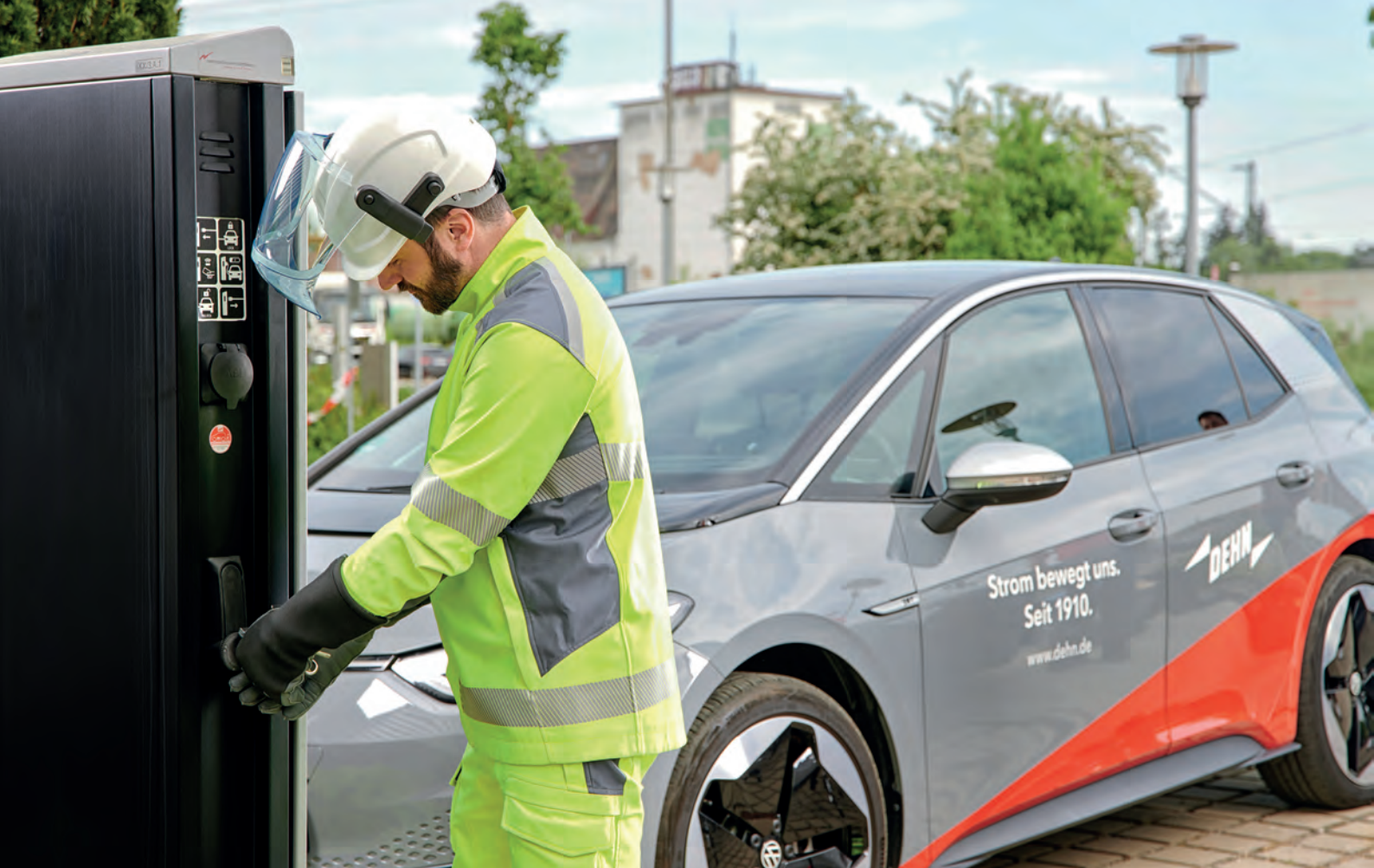
Bild 1. Fachkräfte selbst müssen beim Arbeiten an elektrischen Anlagen ihren eigenen Schutz im Blick behalten. Sie haben die Pflicht, alle Sicherheitsregeln anzuwenden und ihre persönliche Schutzausrüstung (PSA) zu tragen