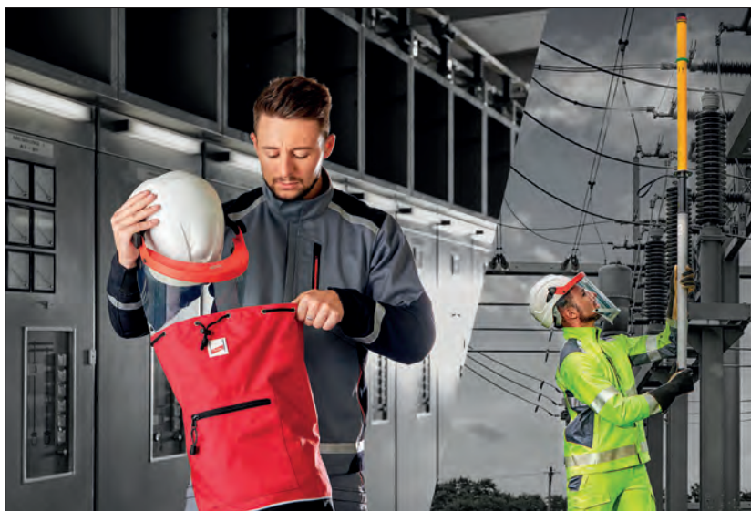
Bild 4. PSAgS Dehncare ArcFit: Schutzkleidung gegen Störlichtbögen sollte auch optisch ansprechend und bequem sein, damit sie konsequent getragen wird

Technische Maßnahmen zum Schutz vor Gefahren durch Störlichtbögen haben Vorrang vor organisatorischen